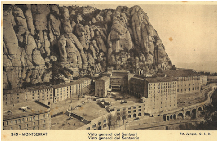
340 - MONTSERRAT Vista general del Santuari Vista general del Santuario

CATALUNYA. GENERALITAT. Crònica de la Guerra Civil a Catalunya . Barcelona: Edicions Dau, 2008-2009, p. 73.