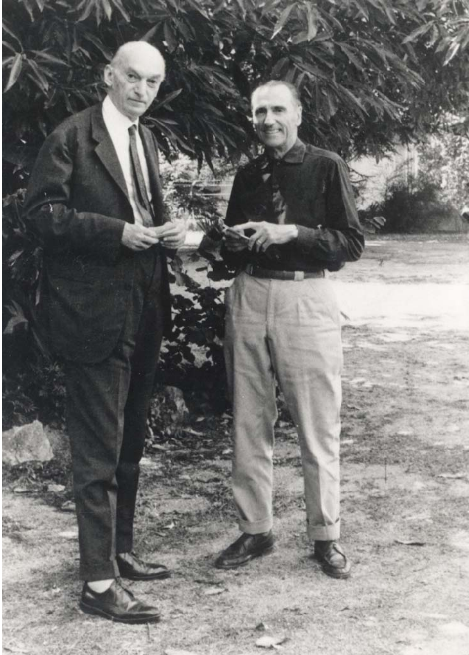
5. Frederic i Josep Mompou. 1968 o anterior