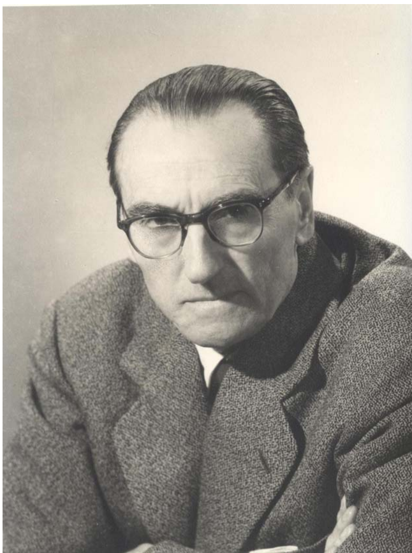
2. Retrat. Vers 1965 (Fons Frederic Mompou. M.4989/8,20)