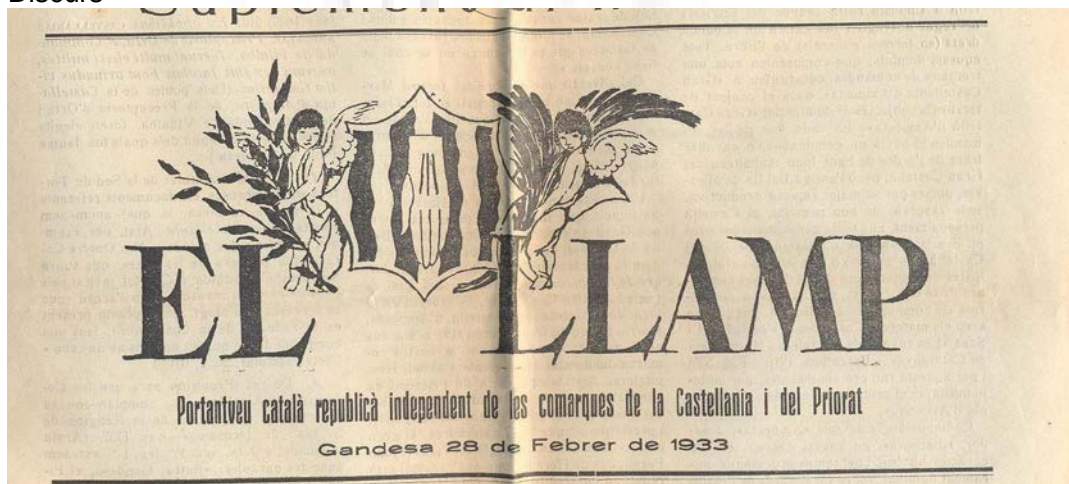
5. Capçalera de El llamp . Gandesa, 1933