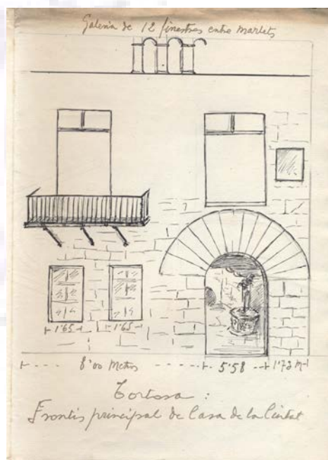
4 Croquis de la façana. Ms. 4639