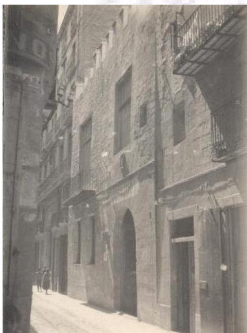
3. Fotografia de la façana. Ms. 4639. 1928