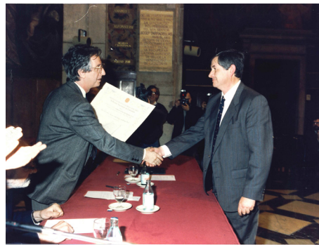
Concessió del Premi Ciutat de Barcelona, 2011