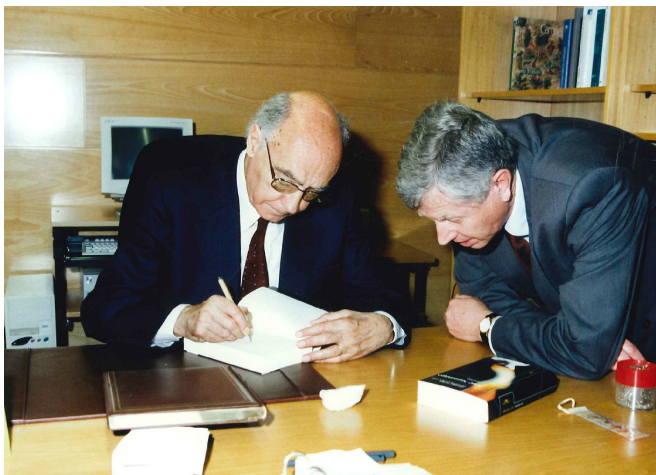
Joan Fontcuberta i José Saramago a la UAB, 2001

Al llarg de la seva carrera acadèmica, ocupà diferents càrrecs, entre els quals el de degà de la Facultat de Traducció i d'Interpretació de la UAB, entre el 1999 i el 2003.