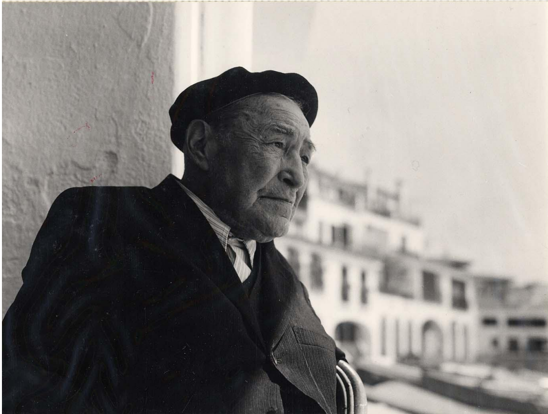
Imatge Josep Pla en costa