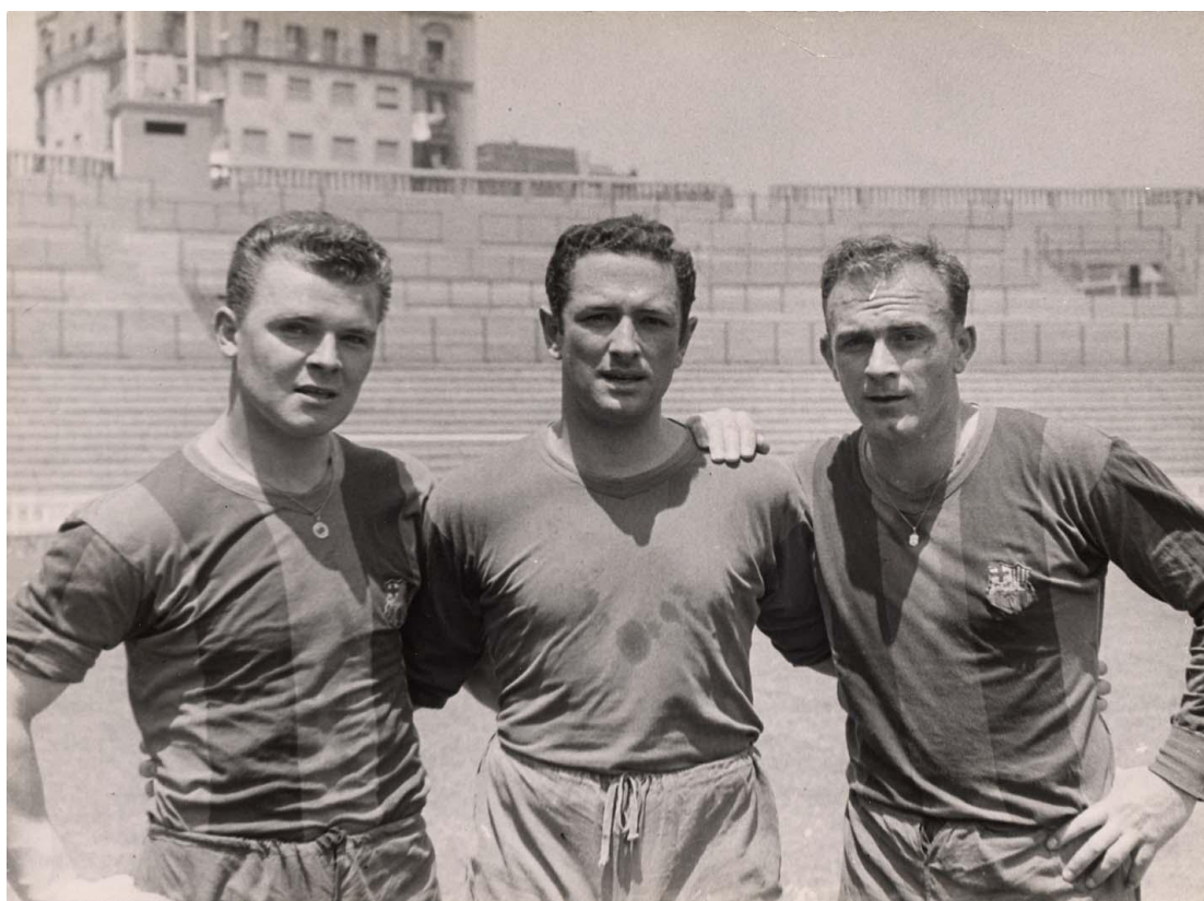
Imatge : L. Kubala, A. Ramallets i A. DiStefano