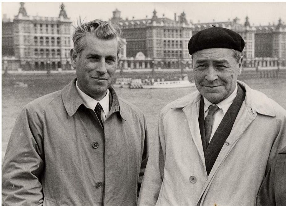
Imatge Londres. 1955