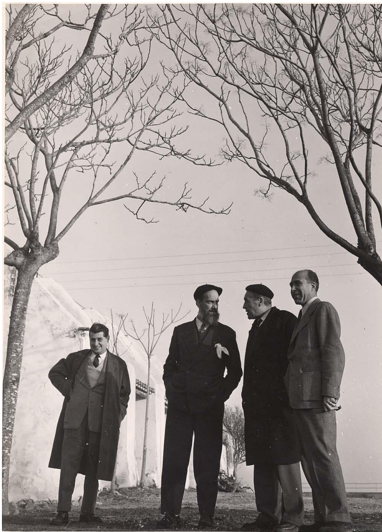
Imatge : (esquerra/dreta) N. Luján, C.J. Cela, M. Delibes