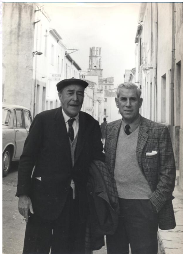
Imatge Empordà, 1967