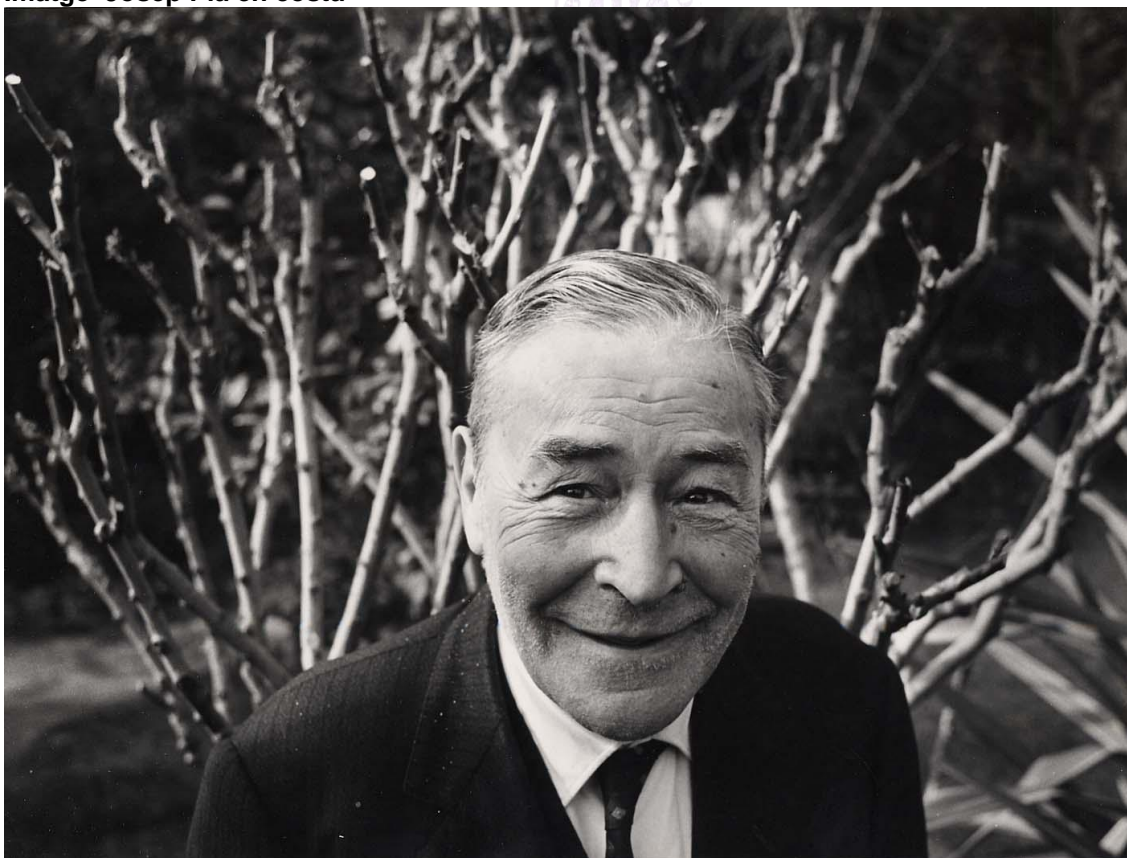
Imatge Josep Pla i brancatge