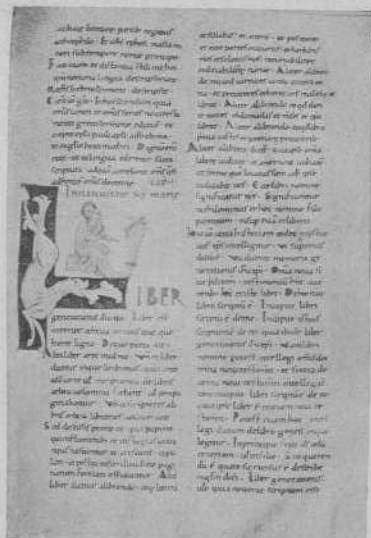
Fig. 3. — Ms. 548, f. 6. Remoius Super Matheum (353 × 246 mm.)