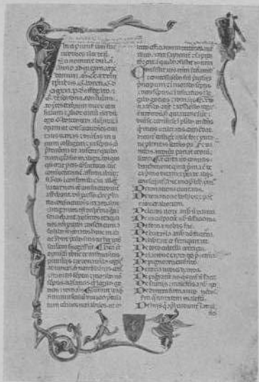
Fig. 2. — Ms. 483, f. 1. Consuetudines Herdensens (370 × 247 mm.)