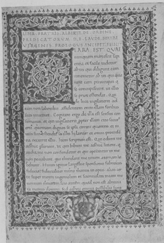
Fig. 6.—Ms. 658, f. 1. ALBERT EL MAGNÈ, De laude beatae Virginis (327 × 224 mm.)