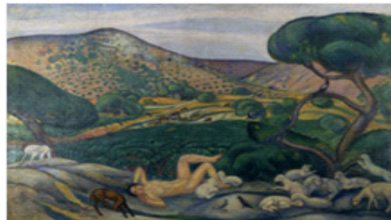
Pastoral , de Joaquim Sunyer (1911).

Una completa biblioteca crítica de diferents autors sobre l'obra de Maragall, les partitures originals i impreses de més de cent músics sobre poemes de l'autor, la col·lecció iconogràfica (dibuixos, gravats, fotografies, quadres, etc.) i uns 10.000 retalls de premsa completen el fons documental del centre.