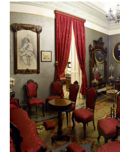
Saló noble, decorat amb retrats familiars