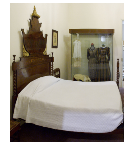
Dormitori d'estil isabelí, mitjan segle XIX