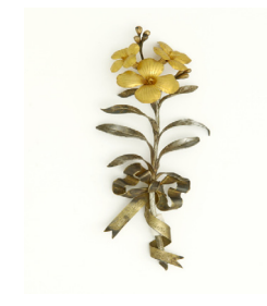
Englantina d'Or. Premi a la poesia "La sardana", guanyat als Jocs Florals de 1894

Joan Maragall i la seva família es van traslladar a la casa del carrer d'Alfons XII l'any 1899. La residència, que s'ha mantingut fins als nostres dies com un punt de reunió de la família, mostra avui un exemple d'una vivenda burgesa de la Barcelona de fa cent anys.