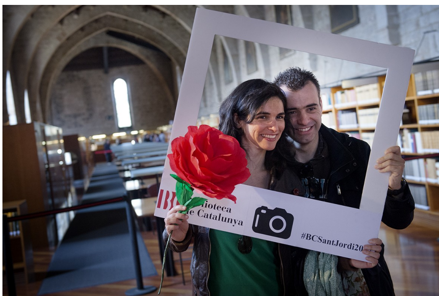
Jornada de Portes Obertes

Així mateix s'han dut a terme diferents presentacions de llibres i discs. D'altra banda, la BC ha cedit els seus espais per a diferents activitats: rodes de premsa, congressos, lliuraments de premis, reunions, gravacions, reportatges fotogràfics, etc.